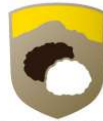
Tòfona d'estiu de Vistabella als peus del Penyagolosa