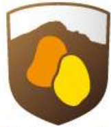
Pataca de Vistabella als peus del Penyagolosa