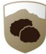
Tòfona de Vistabella als peus del Penyagolosa